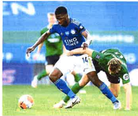
Nigerijski napadač 'liscica' Kelechi Iheanacho