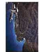
Studija glavne ocjene prihvatljivosti zahvata "Uređenje obale na predjelu Maslinica na otoku Hvaru, Grad Stari Grad" za ekološku mrežu, a koju je za nastajala zahvata HVAR STAR RESURCE d.o.o., Dubrovacka 18, 21 000 Split izradila tvrtka EKO INVEST d.o.o. upućuje se na javnu raspravu.

Javna rasprava u trajanju od trideset (30) dana provodit će se u razdoblju od 13. srpnja 2020. godine do 11. kolovoza 2020. godine.